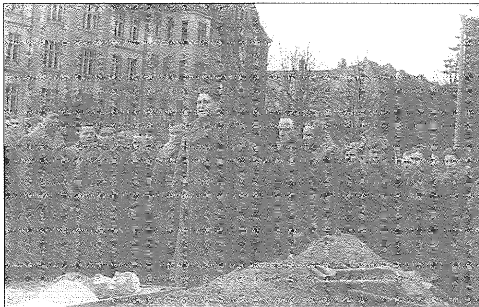
Ilustr. 4. Pogrzeb ppłk. Iwana Wasiliewicza Gacuka przy obecnym Placu Wolności, marzec/kwiecień 1945.